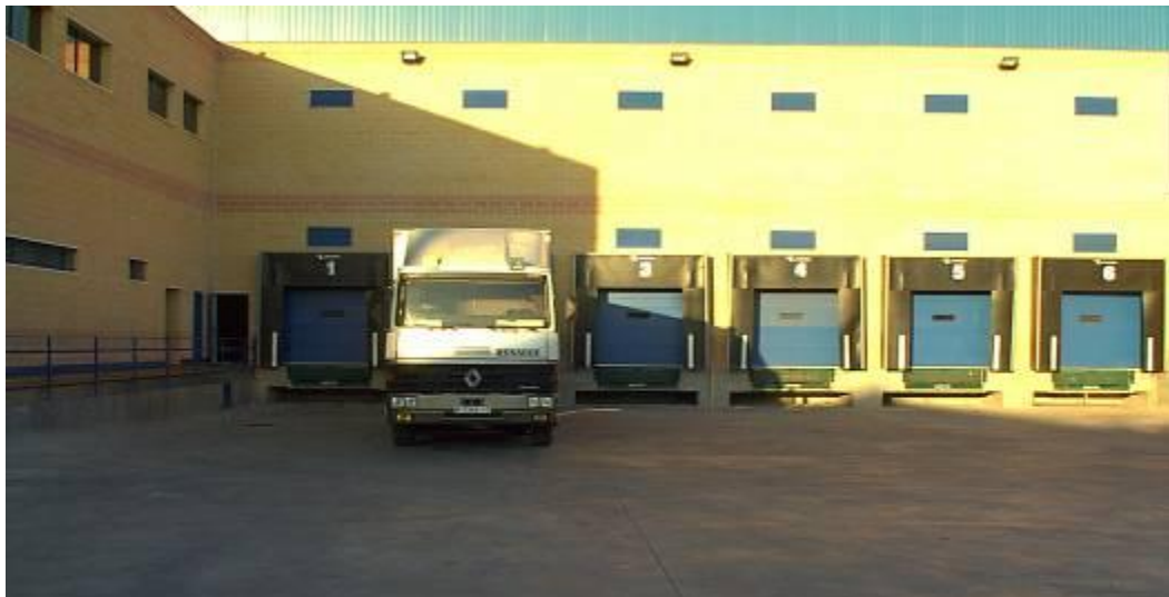
Muelles Nave Villaverde (Madrid)

Nos ajustamos a las necesidades de cada cliente en la medida que nos solicite tanto en los procesos como en las formas, aceptando todo tipo de criterios que nos expongan.