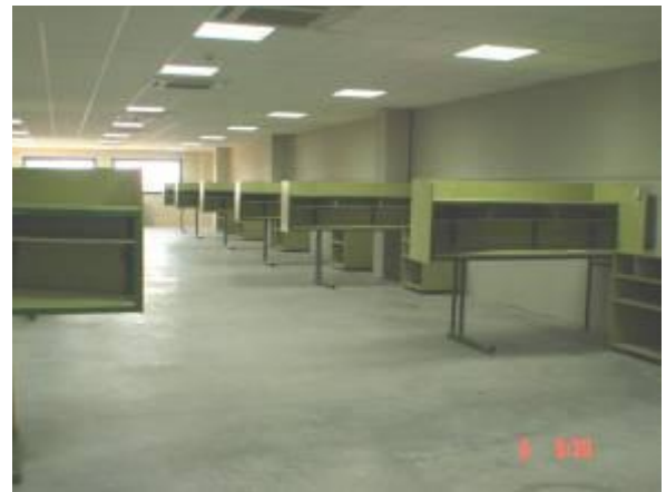
Salas de picking y packing

La gestión de los flujos de mercancía está apoyada por el escaneado y etiquetado de paquetes, optimización de circuitos y de picking & packing garantizando la asignación eficaz del espacio.