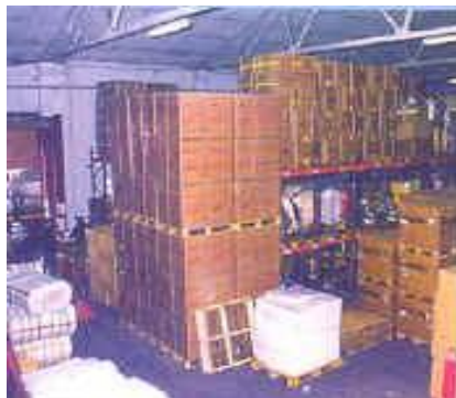
Almacén ADT Coslada (Madrid)