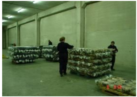
Instalaciones Villaverde (Madrid)