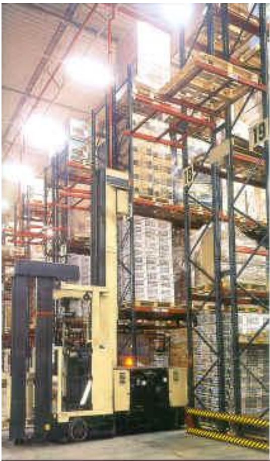
Almacén Villaverde (Madrid)

Apoyado por los sistemas informáticos se obtiene información detallada sobre los artículos almacenados como existencias mínimas, flujos de mercancías, estrategias de almacenaje y preparación de pedidos.